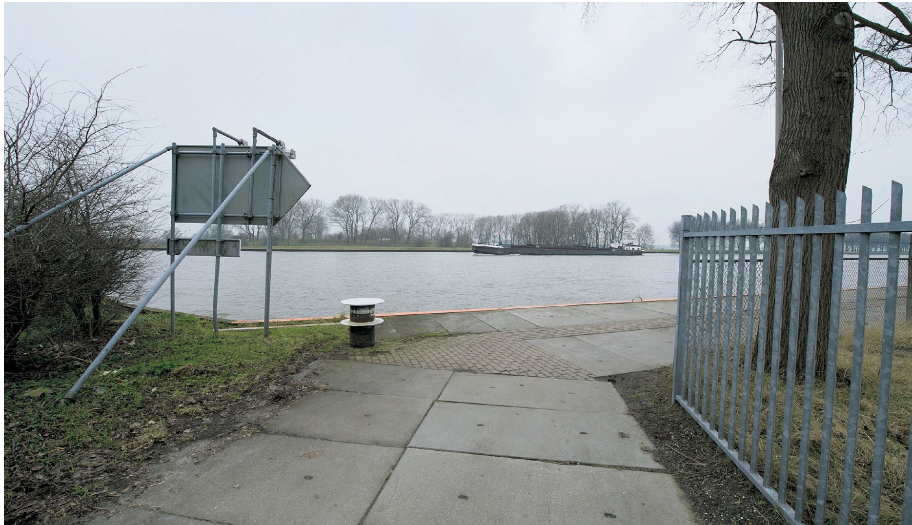
Over het Amsterdam-Rijnkanaal, bij Nigtevecht, moet een fietsbrug komen. Omwonenden, gemeenten en provincies steggelen over het ontwerp.

Er kwamen ook bezwaren van deskundigen die het beeld bewaken van de Nieuwe Hollandse Waterlinie, waartoe het Fort Nigtevecht behoort. Had de ontwerper de opgangen naar de fietsbrug opvallend willen maken? Dat pakt dan „averechts” uit, schreef na-